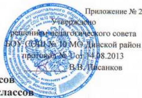
Таблица-сетка часов учебного плана для 6 х - 8 х классов БОУ СОШ № 10 МО Динской район на основе БУП – 2004 на 2013-2014 учебный год