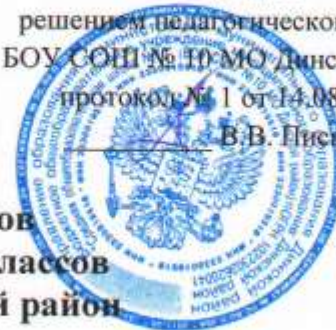
Таблица-сетка часов учебного плана для 10 а , 10 б классов БОУ СОШ № 10 МО Динской район на основе БУП – 2004 на 2013-2014 учебный год