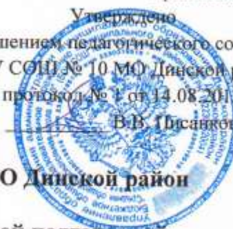
Таблица-сетка часов учебного для 9 х классов БОУ СОШ № 10 МО Динской район на основе БУП – 2004 на 2013-2014 учебный год с предпрофильной подготовкой